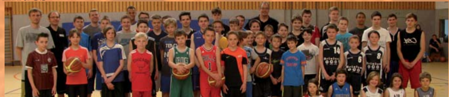
Ostercamp TSG Maxdorf 2014

Bei Geschwistern zahlt nur ein Teilnehmer den vollen Betrag. Alle weiteren Teilnehmer erhalten jeweils 10€ Ermäßigung.